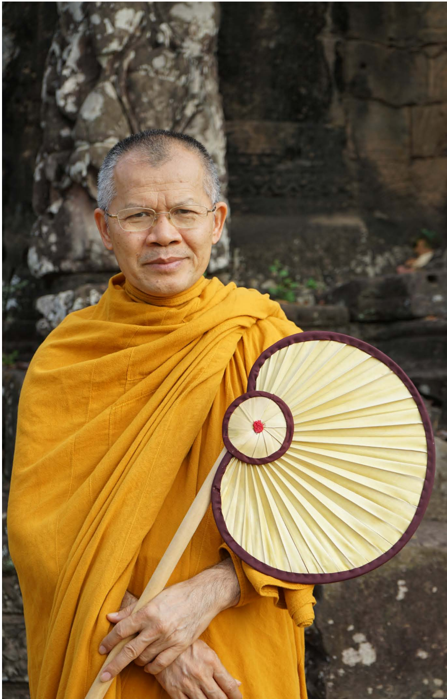
พระกวนารสสมาภิรัช วิ.

ตั้ง เช่น วัดรำเปิง มีนา คือ เนื้อนาบุญ (นั่นคือสงฆ์) และให้โยมมาเช่าทำนาเพื่อปลูกข้าว (วัด) เมื่อได้ผลผลิตเต็มทีโยมก็นำผลผลิตมาให้เจ้าของนาเป็นค่าเช่านา เจ้าอาวาสไม่ใช่เจ้าของนา แต่เป็นผู้รักษาผลประโยชน์ หรือผู้บริหารจัดการ