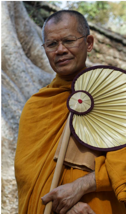
พระภาวนาธรรมาภิรัช วิ.